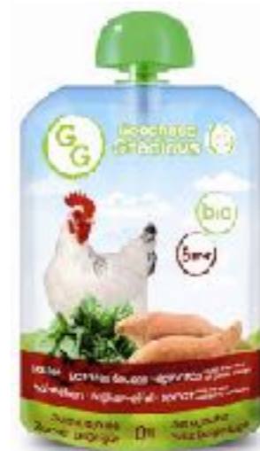
鸡肉，红薯和菠菜泥， 加薄荷及柠檬果汁 140g