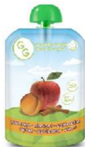
苹果，杏子和肉桂泥 140g