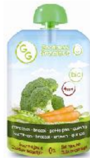
西兰花，胡萝卜，豌豆 和藜麦泥 140g