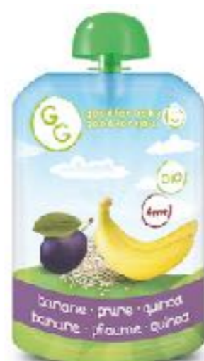
香蕉，李子和藜麦泥 140g